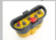
PFANZELT Seilwinden 4 – 10 to Dreipunkt-, Steck-, Festanbau, Aggregate