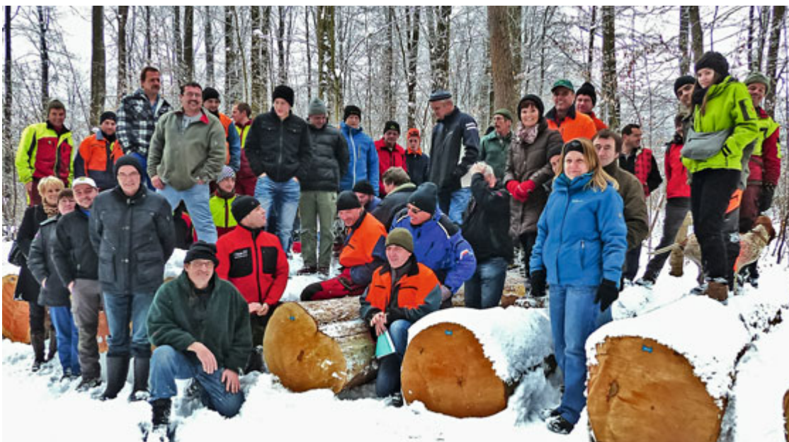
Vue d'ensemble des personnes présentes à la journée officielle

Dans ce petit calcul, je ne compte même pas la partie des produits annexes vendus à perte. Qu'on se le dise!