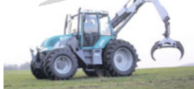
PFANZELT Pm-Trac der vielseitige System-schlepper für Forst- und Kommunaleinsatz