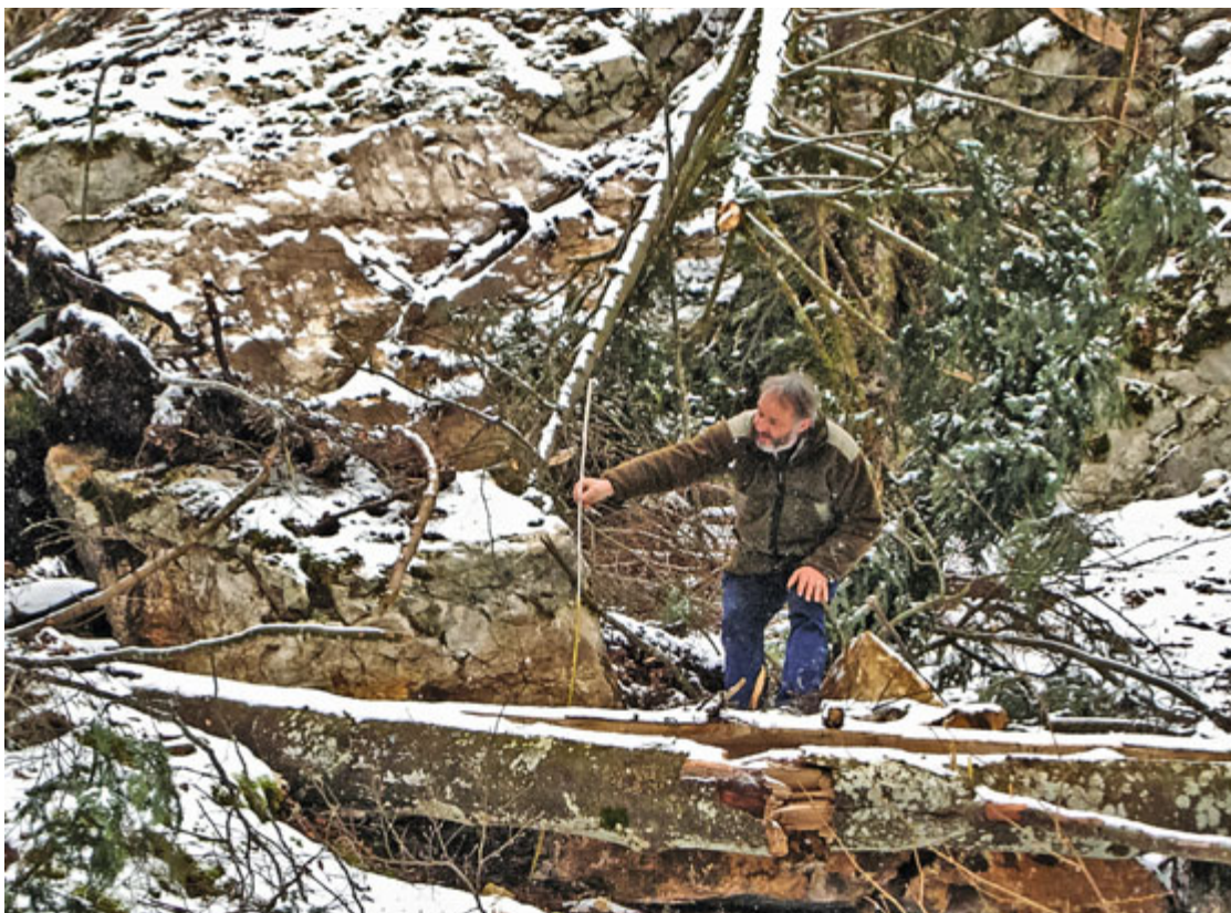
Le hêtre en travers a pu retenir les blocs

Probablement en janvier dernier, des blocs se sont décrochés d'une paroi rocheuse une dizaine de mètres au-dessus de l'arbre en question. En raison de la pente raide de 70 %, ces blocs ont rou-