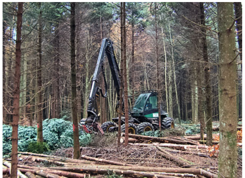
Abbildung 8: Vollmechanisierter Einsatz in reinem Nadelholzbestand in Utzenstorf 2003

Falls noch keine Rückegassen durch den Bestand führen, sollten diese jetzt in