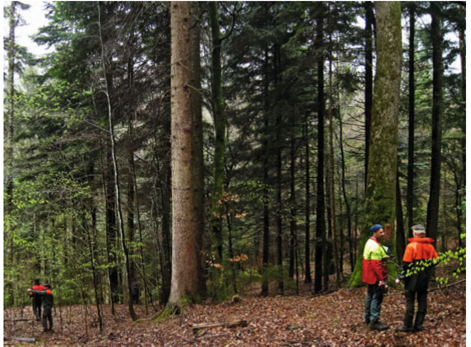
Exercice pratique de martelage sur le marteloscope de Boudry

Les thèmes débattus lors des exercices pratiques sur marteloscope sont notamment: contexte local, mode de traitement, concept de desserte, accroissement, volume sur pied, intensité du prélèvement, rotation des coupes, qualité des tiges, arbre de place, arbre-habitat, multifonctionnalité, incidences économique et écologique du martelage, commercialisation des produits, coûts de récolte.