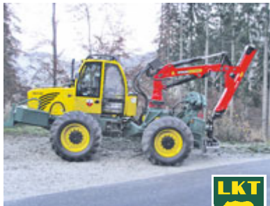
BÄRENSTARK ZUVERLÄSSIG – BEWÄHRT – PREISWERT