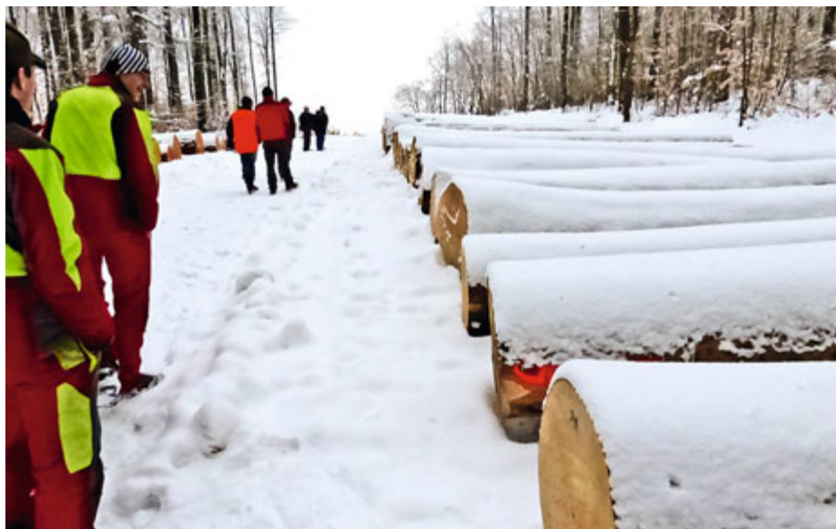
Vente de bois précieux de Gempen, Rolls Royce en la matière

La dernière vente de bois précieux de Gempen (SO) n'a pas failli à sa réputation. Forte de son succès, on pourrait presque la considérer comme la Rolls Royce en la matière. Bien que la vente concerne en premier lieu la région bâloise, des bois y sont acheminés également depuis le Jura et le Jura bernois, notamment. Profitant d'un transport de retour, un vendeur venant de l'Engadine y a amené quelques mélèzes de choix. La vente est organisée conjointement entre le triage forestier de Gempen et l'Association de vente de bois Raurica Holzvermarktung AG à Liestal www.rauricawald.ch . Elle est réservée à des grumes provenant de forêts certifiées.