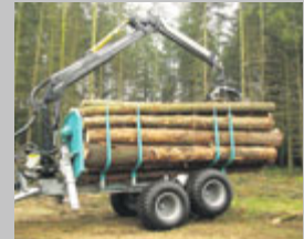
PFANZELT Anhänger von 8 – 15 to