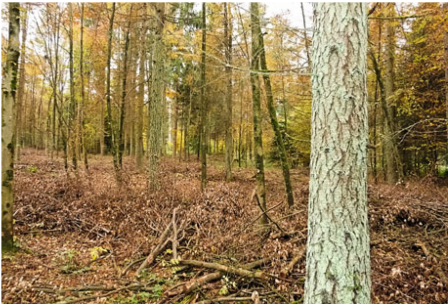
Abbildung 5: Baumholz I, Laub Nadelholz gemischt, mit Lärche, Kirsche, Buche, Eiche Esche, und Ahorn nach erfolgter Durchforstung.

Die Auswahl der Elitebäume hat nach den Kriterien Vitalität, Qualität und Produktivität zu erfolgen. Douglasien, Föhren und Lärchen mit schütterten Kronen, oder Eichen, Ahorne und Kirschbäume unzulänglicher Qualität, sind trotz ihrer Seltenheit zu eliminieren, auch wenn das schmerzt, Versäumnisse können irgendwann nicht mehr wettgemacht werden. Ich versuche in diesem Fall, solche Individuen noch im Nebenbestand zu erhalten aber nur wenn sie in