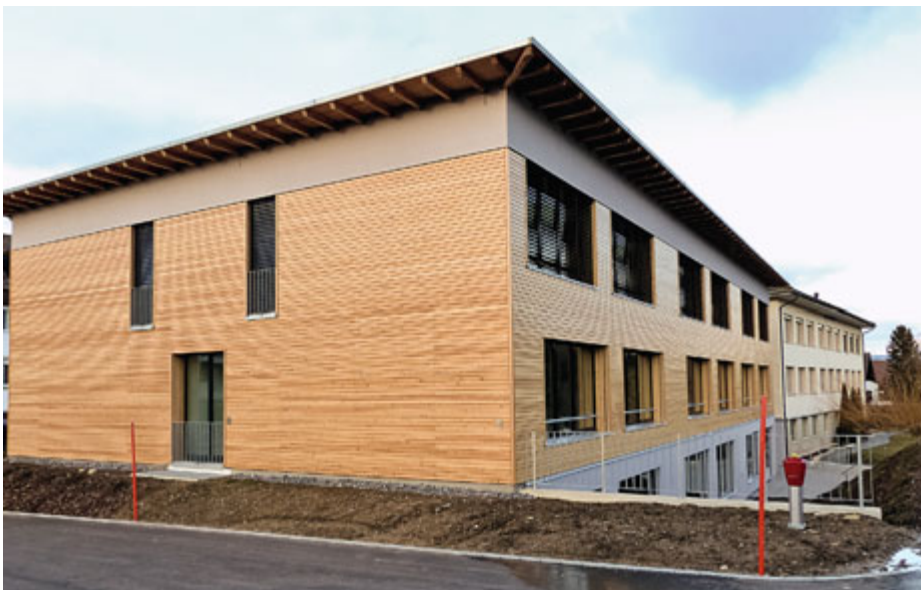
Nouveau et ancien bâtiment du ceff COMMERCE de Tramelan

Tramelan est un exemple judicieux à suivre dans la manière d'exploiter ses forêts.