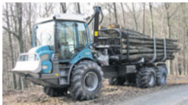
PFANZELT Felix 4-Rad Rückeschlepper, 4 + 6-Rad Rucke-/Tragschlepper mit var. Länge