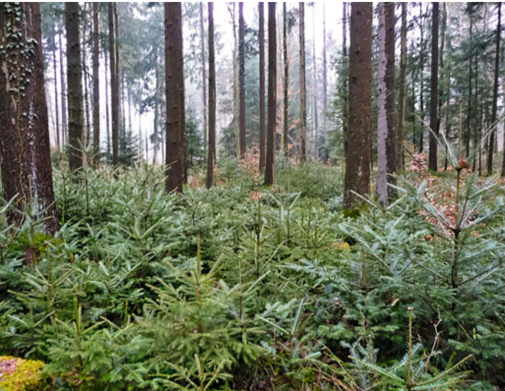
Abbildung 7: Üppige Naturverjüngung 7 Jahre nach der Lichtwuchsdurchforstung in Utzenstorf. Bei Ausführung 2005, im Baumholz I war der Boden mit einer Dicken Nadel-Streuauflage ohne jegliche Verjüngung bedeckt.

die Struktur passen. Es wäre fatal, wenn die ausgewählten Elitebäume aufgrund mangelnder Vitalität eingehen würden.