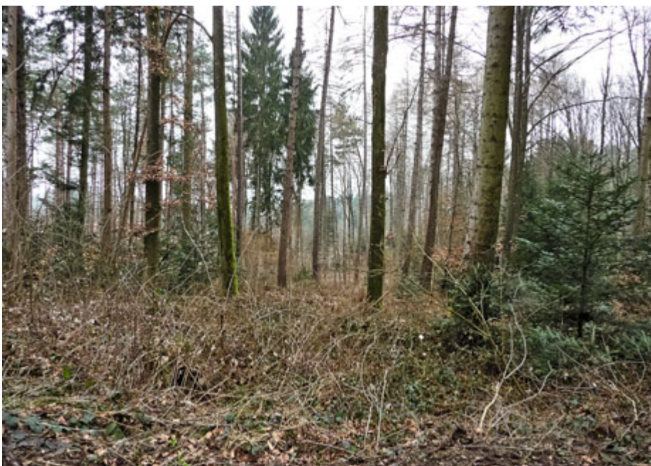
Abbildung 6: Gemischtes Baumholz II mit Fichte, Tanne, Lärche, Föhre, Ahorn, Esche, Buche, Eiche, drei Jahre nach Lichtwuchsdurchforstung in der BG Aarberg