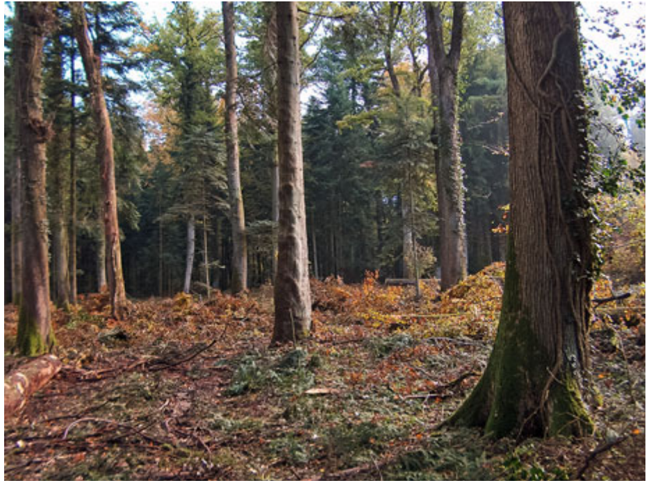
Abb. 1: Lichtwuchsdurchforstung in Eichen Altholz, nach Mastjahr, Gde. Utzenstorf

Zu Abbildung 1: In diesem Bestand waren die Eichenkronen komplett von aufkommenden Buchen, Fichten und Tannen bedrängt worden. Im Kronenbereich herrschte maximale Konkur-