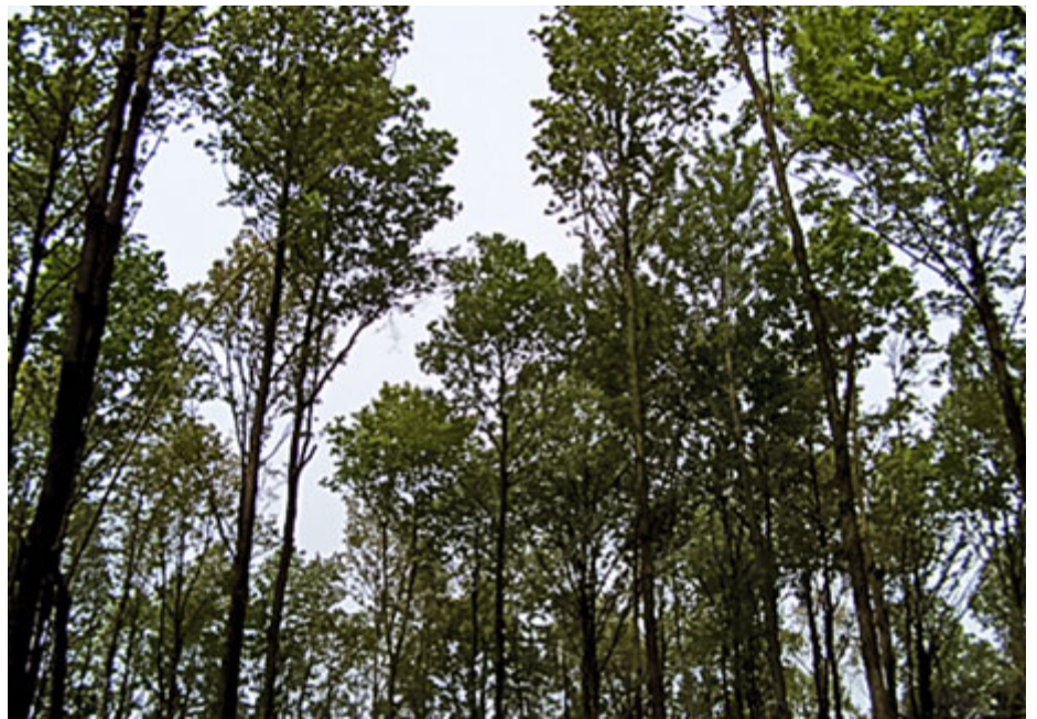
Abbildung 4: Eichenbaumholz I im Reinbestand nach der zweiten Durchforstung

Früher war es üblich, bei Pflanzungen Nadel- und Laubhölzer bunt durcheinander zu mischen. Vielerorts erledigte die Natur was der Waldbauer versäumte. Die Differenzierung fand von selbst statt und am Schluss entwickelte sich die Baumart, welche dem Standort am besten angepasst war. Meist Ahorn, Buche und Esche oder Fichte und Tanne, manchmal einfach auch nur Dornen, Weiden und Hasel. Von den eingepflanzten Lärchen, Douglasien, Kirschen, Eichen und Nussbäumen blieben meist nur der Pfahl und der Wildschutz übrig. Wo weitergepflegt wurde, gingen aber spätestens im Baumholz I, die lichtbedürftigen Baumarten unter. Die Kronen der Föhren, Lärchen, wurden kürzer und die Douglasien gelber, die Kronen der Kirschen und Eichen lang und schmal. Die Angst vor zu star-