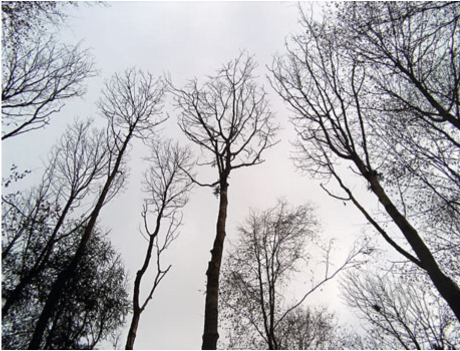
Abbildung 3: Eschen mit hohem H/D Wert nach erfolgter Lichtwuchsdurchforstung

In Abbildung 3, sehen wir Eschen mit kleinen Kronen und sehr hohem Schlankheitsgrad H/D Werte von 80 bis 100, auf sehr wüchsigen ehemaligen Aueböden in Utzenstorf. Trotz der Risiken wurden die Eschen konsequent durchforstet. Vier Jahre nach dem Eingriff sind nur sehr wenige Eschen abgegangen. Der Eingriff und die Eingriffstärke haben sich gelohnt. Zwar geht die Kronenregeneration bei der Esche sehr langsam vor sich oder findet überhaupt nicht mehr statt. Trotzdem war der starke Eingriff viel besser als ein frühzeitiger Abtrieb oder einzelne zaghafte Eingriffe im Bestand. Da die Esche auf mehreren Hektar die Hauptbaumart ist, muss mit ihr gearbeitet werden. Bestandesumformungen sind in der Aue sehr aufwändig, da freigestellte Flächen sofort mit Waldrebe, Traubenkirsche und Hasel überwuchert werden. Interessant ist, dass die Eschenwelke in den gut freigestellten Kronen bis heute keine erheblichen Schäden verursachte, welche zu Ausfällen führen. Zukünftig werden die Bestände gut beobachtet, wenn sich im Unterwuchs andere Baumarten wie Buche, Eiche oder Kirschen entwickeln, werden diese gezielt gefördert um eventuelle Ausfälle bei der Esche mit Naturverjüngung kompensieren zu können.