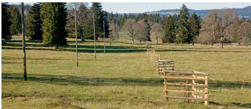
Plantation d'une rangée d'arbres aux Prés-de-Cortébert

Ce projet a été rendu possible grâce à la Fondation pour la protection et l'aménagement du paysage (FP), qui apporte son soutien au Parc sur l'ensemble de la démarche. Elle a pu appuyer le déblocage de fonds auprès de bailleurs, notamment le FSP (fonds suisse pour le paysage).