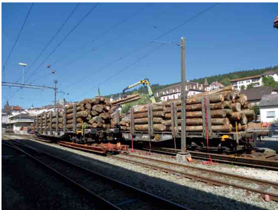
Wagon de bois en gare de Tramelan prêt au départ.

Le point d'entrée de Tavannes alimente en wagons les gares de Tramelan, Les Reussilles et Les Breuleux. Sur ce tronçon, les wagons sont à disposition du chargement du bois à raison d'un maximum de quatre wagons par jour, les mardis et jeudis.