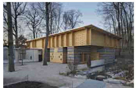
Siegerprojekt des Prix Lignum 2012

Der Verlag Hochparterre gibt ein Sonderheft in drei Sprachen über den Prix Lignum 2012 heraus. Es erscheint als Beilage zum Hochparterre No. 10/2012 und stellt alle 50 Preisträger vor. Als Ergänzung zum Sonderheft gibt der Verlag Hochparterre die App „Prix Lignum 2012. Holzbauten ab 2007“ für iPhone und iPad heraus. Die App kann ab dem 27.9.2012 unter http://itunes.apple.com/ch/app/prix-lignum-2012/id557171099?mt=8 bezogen werden. Alle eingereichten Projekte zum Prix Lignum 2012 werden auf der Homepage www.prixlignum.ch präsentiert. Nationale Ausstellungen Prix Lignum 2012 28.9. – 18.10.2012: Umweltarena Spreitenbach 8.11. – 11.11.12: Hausbau- und Energiemesse Bern