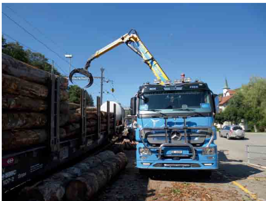
Chargement de bois en gare CJ à Tramelan.

Si du côté CJ tout est fait pour optimiser les possibilités de chargement du bois sur le train, il n'en va pas de même partout. Espérons que l'exemple CJ donne des idées au reste de la Suisse pour maintenir ouverts certains quais de chargement de bois qui ont depuis quelques temps un avenir plus qu'incertain !